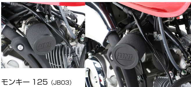
モンキー 125 (JB03)